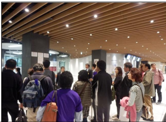
1階「セルフアクセスセンター」前で職員からの説明