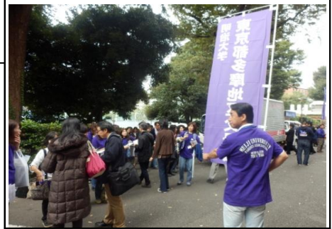
受付時間より早く、参加者が続々ご来場