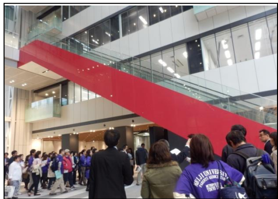
1階「アトリウム」オシャレなエスカレーター

野球応援から長時間にわたるイベントがすべて終了したのは、あたりがうす暗くなった午後4時半ごろ。ハードな充実した1日が終了しました。