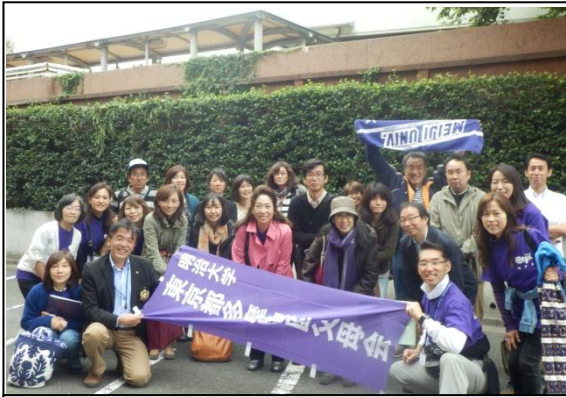
次は明早ラグビー！ みんなで応援しましょう！