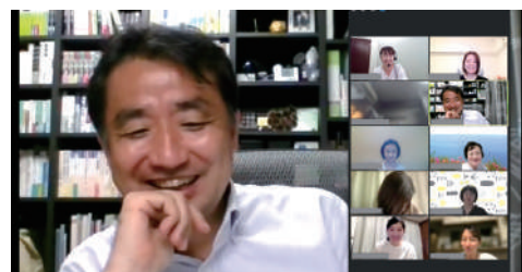
授業風景(ゼミナール)