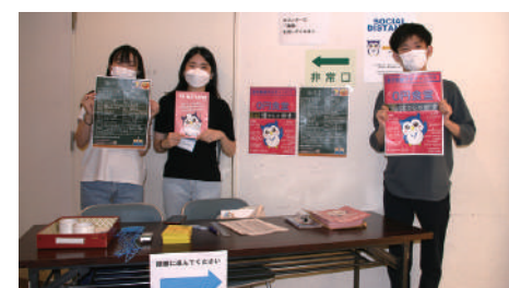
学生健保の企画で「0円食堂」が6/20～7/1の平日に実施されました。（駿河台キャンパス受付で準備をする学生保険委員会の学生さん）