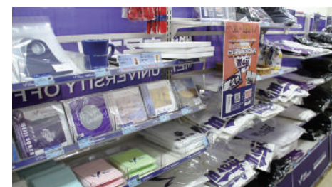
明大マート駿河台店長の許可を受け、明大グッズコーナーに突撃！文房具をはじめ、めいじろうや体育会の応援グッズもあります。