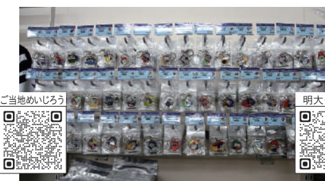
47都道府県の特徴をもとにした「ご当地めいじろう」のキーホルダーも置いてあります！（各¥350）ご興味のある方は右のサイトをご覧ください。