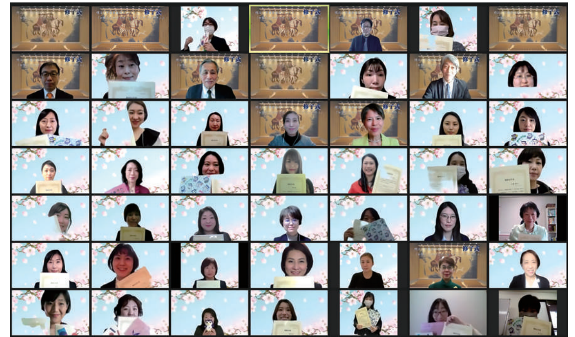
2021年度 秋期修了式集合写真