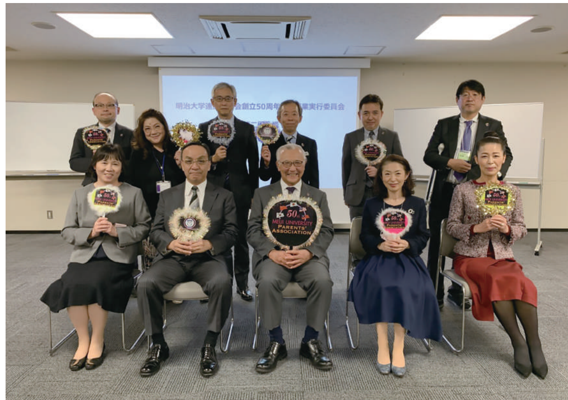
第2回「明治大学連合父母会創立50周年実行委員会」11月12日@父母センター会議室

また、「父母会とは何か」パーパスとしての明文化にも取り組むことが決定されました。父母会らしく明治大学の発展・向上に寄与し、明大生を支え、応援することを通じ、父母自身が心身および社会的に幸福でより充実した生活を送ることを、より分かりやすく言語化します。