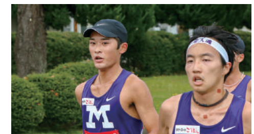
箱根駅伝で雄姿をみたい! 競走部