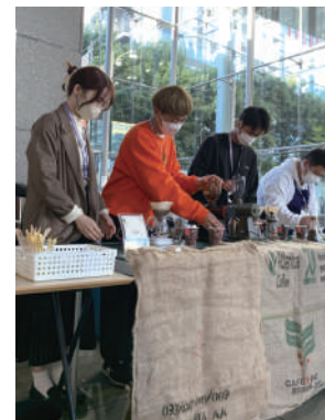
ハンドドリップで提供される こだわりの一杯

アカデミーコモンの広場とエントランスが、香り高くピアノの調べに乗せて、その名のとおり広く社会との接点になっていくようです。学生たちのプロジェクトが多く共感の輪を広げることを願います。