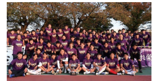
関東大学リーグ戦で2年ぶり優勝、 インカレで全国制覇を目指すサッカー部