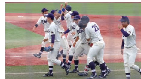
硬式野球部は、東京六大学秋季リーグ戦を制し 明治神宮大会(秋の全国大会)へ