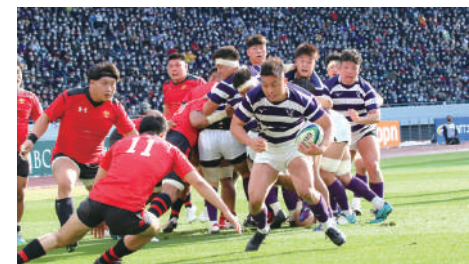
伝統の紫紺のジャージが映えるラグビー部。 昨年のリベンジで全国優勝だ!

【取扱募金: 未来サポーター募金スポーツサポート競走部・サッカー部合宿所建設振興資金】