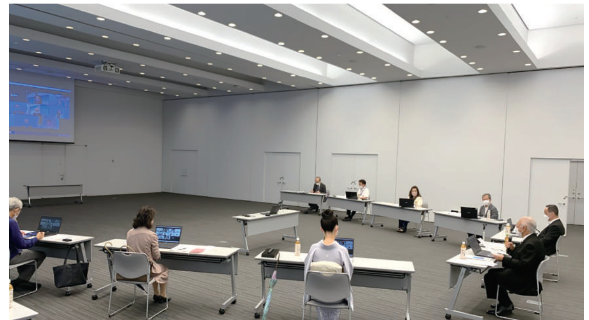
第1回「明治大学連合父母会創立50周年実行委員会」は9月19日、ハイブリッド方式で開催された