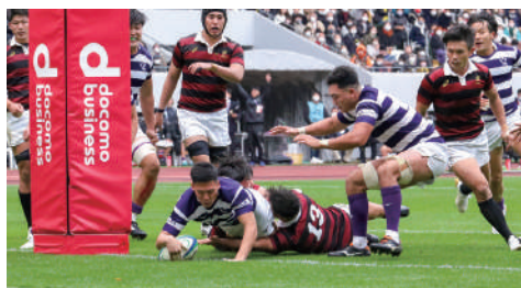
ラグビー部は明早戦に勝利し、関東対抗戦2位で全国大学選手権へ。予想される強豪たちとの再戦を制し、栄冠を勝ち取る！