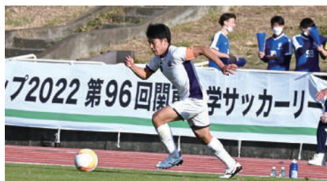
W杯サッカーで世界中が歓喜に沸いた2022年。 『新合宿所』から次の世代を担うのは君たちだ！プラボー！！

【取扱募金: 未来サポーター募金スポーツサポート・競走部・サッカー部合宿所建設振興資金】