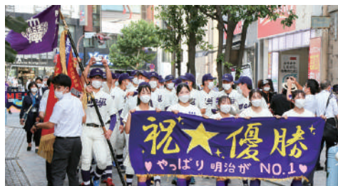
硬式野球部は、秋の全国大会（明治神宮大会）で優勝！ 六大学野球優勝パレードと祝勝会に華を飾りました。