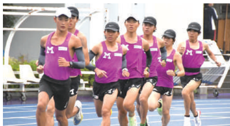
箱根駅伝予選会を2位で通過し、5年連続本大会出場となった競走部。コンディション万全で戦おう！