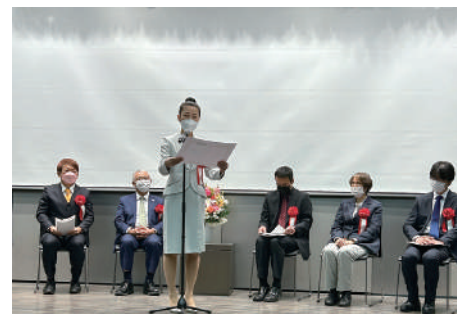
連合父母会長賞を発表する御子柴会長

このコンテストは、留学生スピーカーと日本語アドバイザーがチームを組み、約2カ月間協力してスピーチを作り上げます。運営にあたっては国際交流団体キャンパスメイトも加え60名を超える学生たちが協力する素晴らしい取り組みで、連合父母会は後援という形で支援しています。