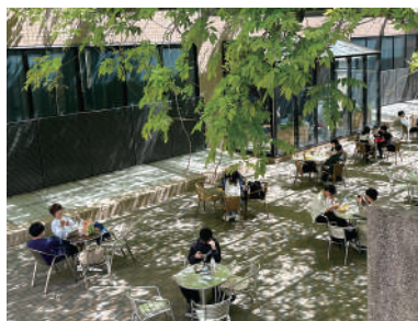
昼食のひと時。駿河台キャンパス「藤棚広場」

投稿フォームより俳句をお送りください。 優秀句・秀句に選ばれた方は、本紙に掲載するとともに、素敵な明大グッズをプレゼントします。