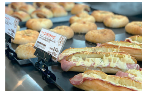
驚きの低価格! どれも焼き立て

基本的な感染対策を意識しつつも、焼き立てパンの香りとともに、楽しい昼食時間が戻ってきました。その賑わいにも、お腹も胸もいっぱいです。