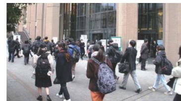
入学試験を実施 がんばれ！あしたの明大生！！