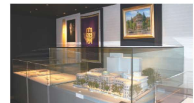
大学史展示室や博物館（商品・刑事・考古）の各資料も常設で展示中