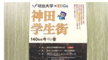
【博物館】特別展「神田学生街 140年の今⇄昔」を4/10(日)まで開催（開館時間等を大学HPでご確認ください）