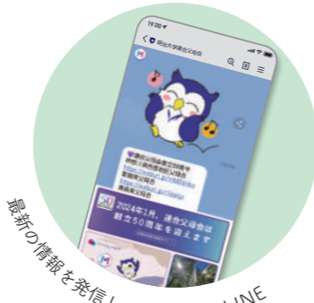
最新の情報を発信している父母会LINE