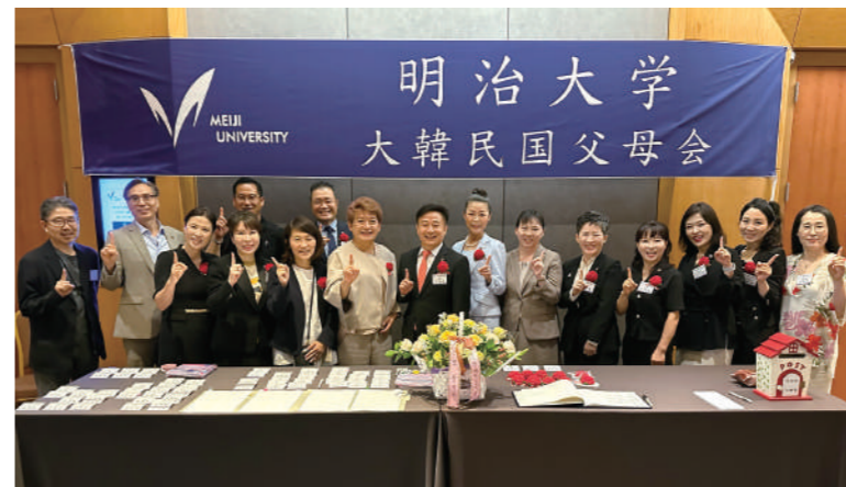
大韓民国父母会 2023 定期総会兼新入生父母歓迎会 2023年7月1日@カンナム COEX