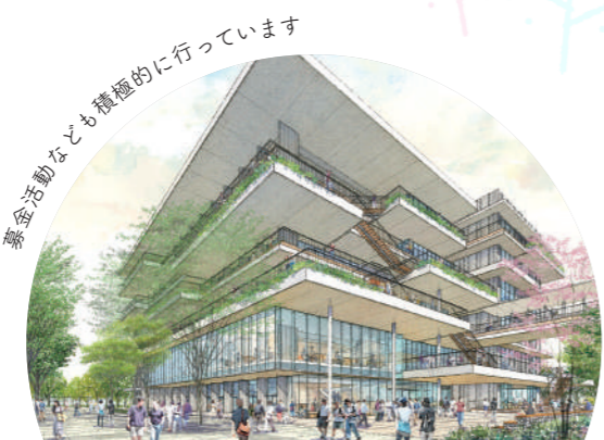
募金活動なども積極的に行っています