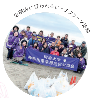
定期的に行われるビーチクリーン活動