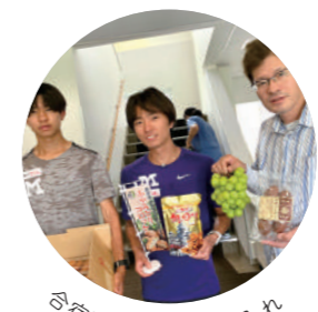
合宿所へ応援の差し入れ