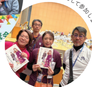
運営スタッフとして参加しました