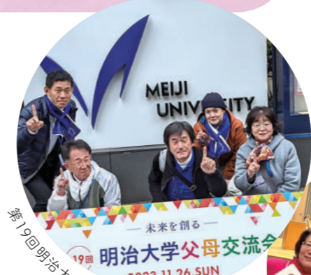
第19回明治大学父母交流会に参加しました