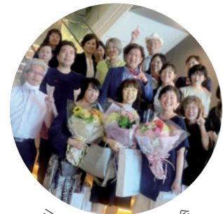
三重県父母会総会・懇談会