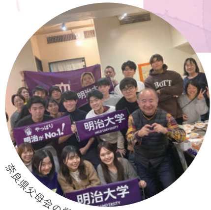
奈良県父母会の学生交流会 in 東京