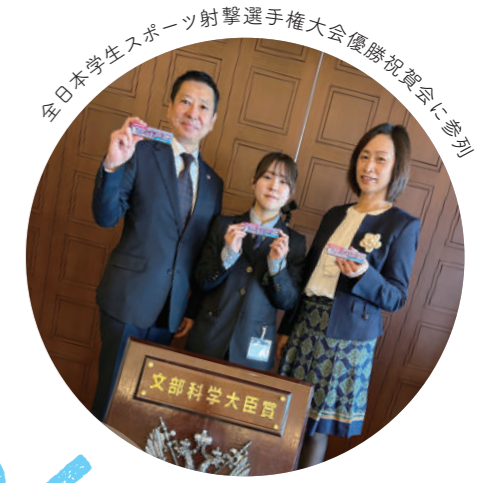
全日本学生スポーツ射撃選手権大会優勝祝賀会に参列