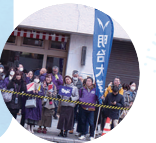
沿道から駅伝応援