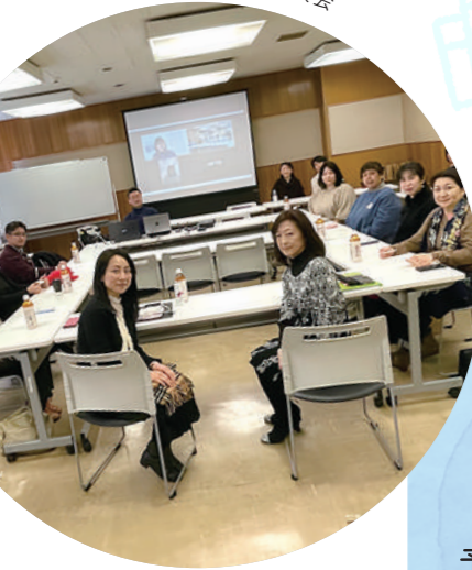
宮城県父母会懇談会

各地区父母会の年度計画や予算を審議する総会、大学の現況報告や就職支援体制、学生生活などについて説明する懇談会を開催します。