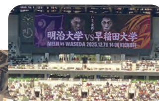
国立競技場のスタンドを見た瞬間、雰囲気に圧倒され試合前なのに感動しました!!