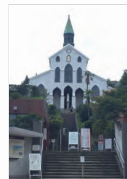
大浦天主堂は2018年に世界文化遺産「長崎と天草地方の潜伏キリシタン関連遺産」の構成資産に登録されました。