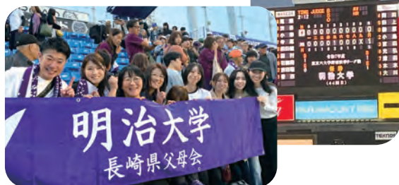
これまで野球応援しかしたことがなく、他のスポーツも応援したいとの要望がありました。