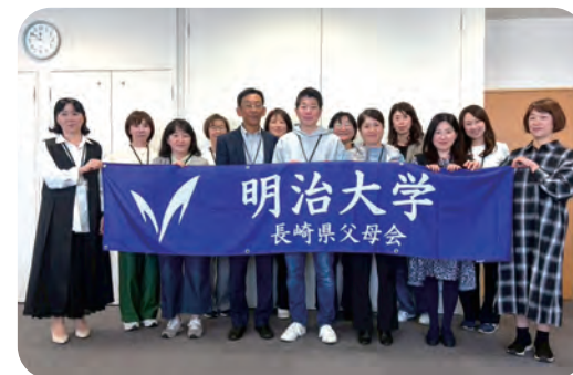
これからも学生の支援とともにご父母のみなさまも第二の母校として楽しく取り組んでいきます！