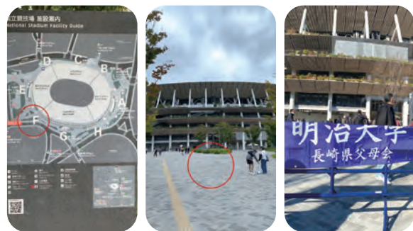
国立競技場は大きいので集合場所はどこにするか、迷わず集合できるか事前調査....

また、ルールが分からない方への配慮や、遠方開催による参加ハードルなど課題も多く、準備段階では試行錯誤の連続でした。