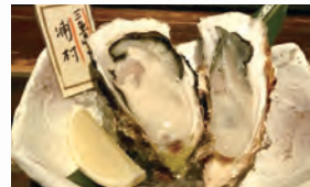
浦村の牡蠣。身がぷっくりして見てるだけで美味しそう！ レモン絞って召し上がれ！