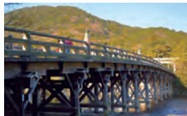
“俗界と聖界との掛け橋” 宇治橋は式年遷宮(20年ごと)でまるごと 架け替えられるって知ってましたか？

他にも松阪牛、伊勢海老、的矢・浦村の牡蠣、四日市とんてき等食べ物も魅力が一杯の宝石箱みたいな魅力が三重の凄さです！