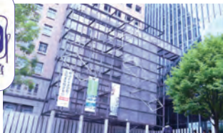
アカデミーコモン B1Fにあります