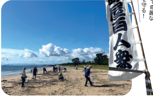
「久しぶりに海に来たね～。気持ちいい～」