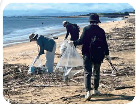
「沢山あるね～、頑張ろ！」「今日は暑いね～」 拾ったごみの成果を見ると達成感が溢れます▶