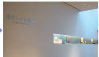
下って降りると、明治大学博物館に到着!