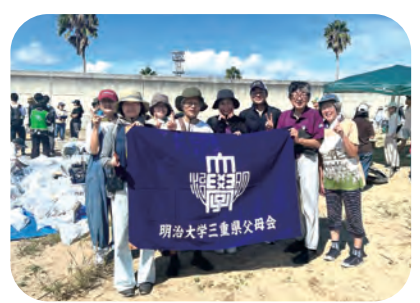
晴天の町屋海岸にて、みんなでパチリっ！

そんな中、以前から町屋海岸清掃に参加していた役員から「とても良い活動だよ」と提案がありました。清掃を通じて交流が生まれ、地域にも貢献できる点が魅力となり、今年度の活動に取り入れることになりました。